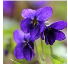
La violette odorante