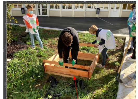
Montage d'un carré potager