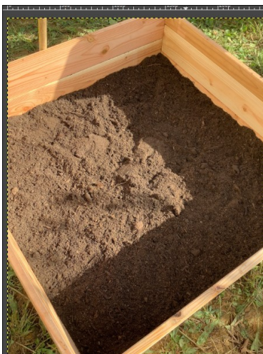
Carré potager fini