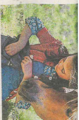
« Poly », le dernier film de Nicolas Vanier ma Le Majestic à Lisieux.

Le cinéma Le Majestic va accueillir plusieurs projections de films dans le cadre du festival Génération durable, un festival organisé par la MJC de Bernay et par l'agglomération Lisieux Normandie.