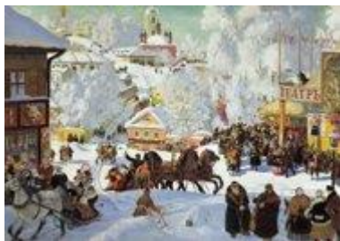
5/ Boris Koustodiev, Mardi gras («Масленица»), 1916

avait sa datcha . Les garçons se ressemblent mais le peintre laisse deviner des caractères différents et invite à imaginer leurs pensées. Le tableau est exposé au Musée russe à Saint-Pétersbourg.