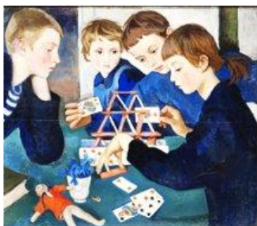
7/ Zinaïda Serebriakova, Chateau de cartes («Карточный домик»), 1919

Serebriakova côtoie les grands représentants du monde artistique russe depuis son enfance et, grâce à son talent, est promise à un parcours prometteur. Mais la révolution de 1917 bouleverse sa vie. Ce tableau représente les enfants de l'artiste, qu'elle élève seule après le décès du père. On les voit absorbés par le jeu, leurs visages semblent avoir perdu l'insouciance de l'enfance ; on imagine leurs chuchotements, les petits bruits de la maison. Le château de cartes tiendra-t-il ? En désaccord avec le régime soviétique, Serebriakova émigre en France en 1924. Le tableau est conservé au Musée russe à Saint-Pétersbourg.