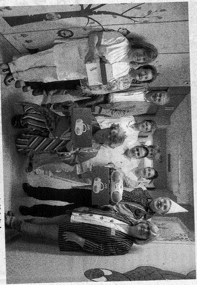
Les Diffuseurs de Bonheur ont remis les dons au service pédiatrie de l'hôpital.