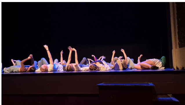
répétition générale, mai 2025

Les élèves présentent en fin d'année des « petites formes » issues de ce travail à d'autres classes et aux parents ! Depuis deux ans, nous avons la chance de présenter le travail au théâtre de Lisieux.