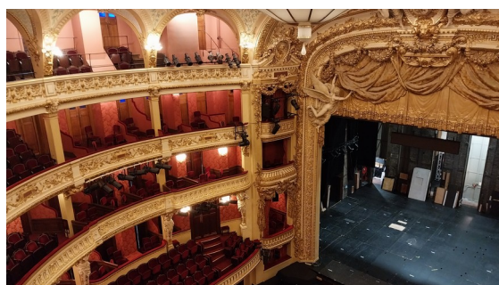
visite de l'opéra comique, janvier 2025

Les élèves doivent assister au cours de l'année à un certain nombre de spectacles qui leur permettent de découvrir des textes, des auteurs, des metteurs en scène, des comédiens, des troupes et des lieux théâtraux. Ils ont également l'occasion d'assister à des répétitions (générales ou partielles) pour être au cœur du processus créatif, de rencontrer des professionnels (comédien, metteur en scène, créateur de lumières, scénographes...), de visiter différents théâtres.