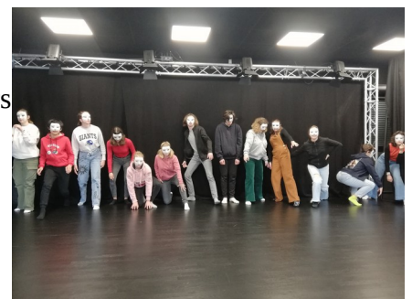
jouer avec un masque